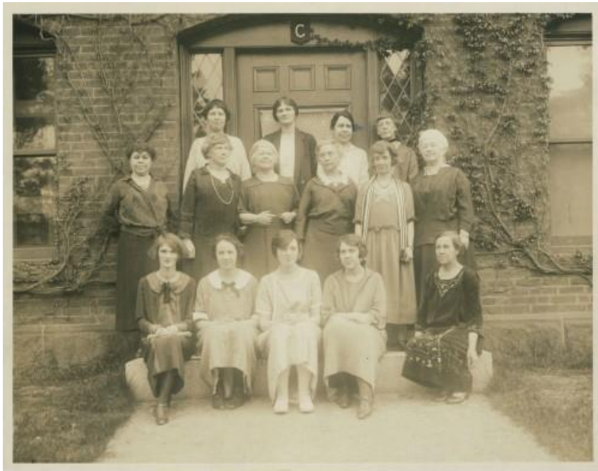
Harvard University, Harvard University Archives, W360663_1